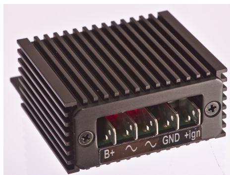
Abbildung 1 Anschlüsse des Reglers