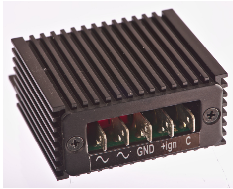
Abbildung 1 Anschlüsse REG2.