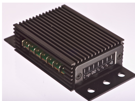
Abbildung 1 Anschlüsse von REG1