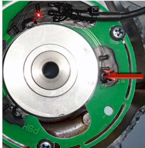
Abbildung 6 Dieser Sensor wird für die Grundeinstellung verwendet.