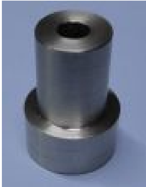
Abbildung 2 Mitnehmer