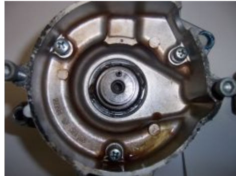
Abbildung 2 Mitnehmer montiert auf der Welle.