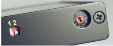
Abbildung 7 DIP-Schalter und Drehschalter.

Sollten keiner der beiden Werte des Drehzahlbegrenzers passen, dann können sie die Zündbox einschicken zur Umprogrammierung des Drehzahlbegrenzers. Es können zwei beliebige Werte programmiert werden.