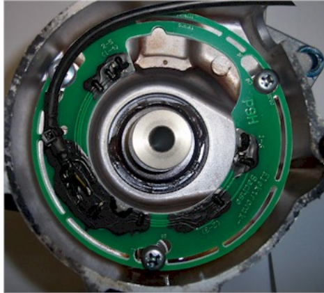
Abbildung 2 Montiertes Pickup und Mitnehmer. Der Magnetring ist noch nicht montiert.

Um den Primärwiderstand zu messen, klemmen sie beide Pole der Zündspule ab und messen den Widerstand zwischen Plus und Minus mit einem Multimeter.