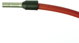
Die Aderendhülse wird soweit es geht auf das Kabel aufgeschoben.