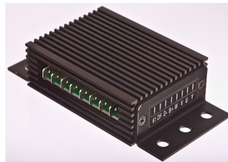
Abbildung 2 Anschlüsse des Reglers REG8-P.

Die Ladekontrollleuchte ist für diesen Regler obligatorisch und muss angeschlossen werden, da der Regler, wie auch der Originalregler, den Strom von der Ladekontrollleuchte zum Vormagnetisieren der Feldwicklung benutzt. Wenn keine Leuchte genutzt