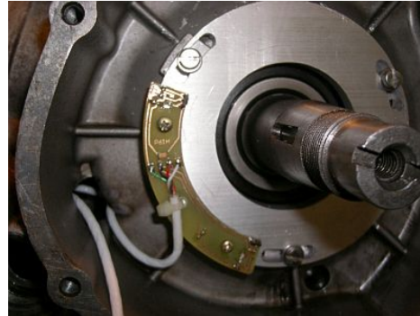
Montage des neuen Pickups.

Zuerst komplett die alte Grundplatte und die Magnete aus der Schwungscheibe entfernen. Dann wird die neue Grundplatte mit dem Pickup eingesetzt und am Anschlag gegen den Uhrzeigersinn in den Langlöchern nur leicht festgeschraubt. Weiterhin werden die sechs Senkschrauben aus der Schwungscheibe entfernt und drei davon gleich durch eine hochfeste Variante ersetzt (im Lieferumfang). Nun wird der Magnetring zusätzlich mit den verbliebenen Schrauben in dem Schwungrad befestigt. Die Markierung in dem Magnetring muss sich in der Nähe der Federnut befinden. Das Kabel wird durch den Kabelkanal und die Verschraubung geführt. Zuletzt wird die Schwungscheibe wieder aufgesetzt, dabei darauf achten, dass der untere Rand nicht am Kabel schleift.