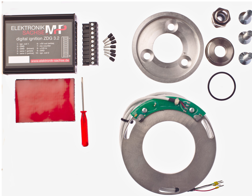
Abbildung 1 Lieferumfang

Ein weiteres Vorurteil ist, daß Wasted Spark-Systeme nicht so hoch drehen. Unsere ZDG3-Zündsysteme sind darauf ausgelegt, mit Zündspulen mit einem Primärwiderstand zwischen 2\Omega - 5\Omega zu arbeiten. Dies erlaubt eine optimale Ladezeit der Zündspule und sorgt dafür, daß unsere Systeme bis 12 500 U/min drehen. Dies reicht sogar für die meisten Zweitakter aus. Spezielle Versionen, die bis 18 000 U/min drehen, sind ebenfalls erhältlich.