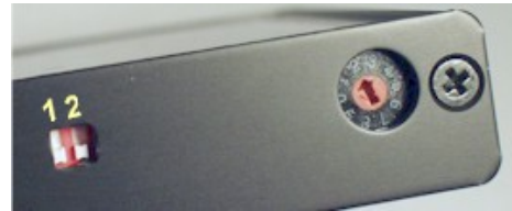
Abbildung 3 DIP-Schalter und Drehschalter.

Doppelzündung (zwei Zündkerzen pro Zylinder) benötigt weniger Frühzündung. Davon abgesehen, ist es nicht so leicht, eine optimale Kurve zu finden. Unterschiedliche Kurven haben unterschiedliche Eigenschaften und es ist nicht immer eindeutig ob eine Kurve „besser“ ist als eine andere oder nicht vielleicht nur „anders“. Ein Prüfstand ist für die optimale Kurvenfindung hilfreich. Ansonsten kann man natürlich auch während einer Tour die Kurven durchprobieren und testen, wie sie sich auswirken. Falls der Motor klopft, sollte die Frühzündung auf jeden Fall zurückgenommen werden. Das ist ein klares Zeichen von zu viel Frühzündung.