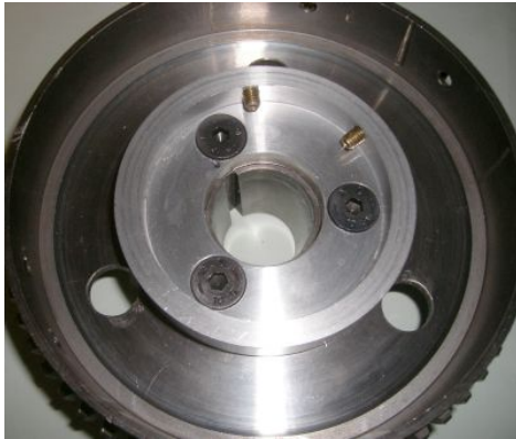
Befestigung des Magnetringes.